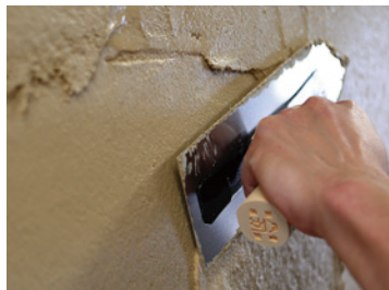
泥灰材料_施工方法