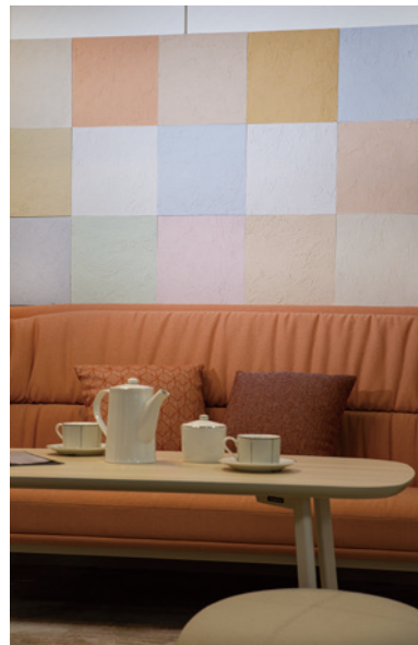
室内装修用墙面板