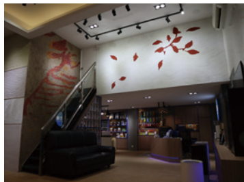
泥灰材料_施工案例1

使用Shirasu (南九州の火山喷发物), 企划、制造、销售天然的建筑材料、室内装饰杂货。