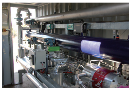
GRANEX熱伝導テスト装置