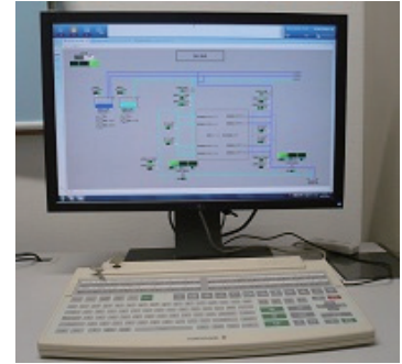
実証プラントで使用されている 『CENTUM VP』

また、実験ではデータの取得、解析が重要です。『CENTUM VP』では、必要なデータを容易に取得することができるだけでなく、再利用可能な汎用形式のファイルに自動保存されるので、解析工程へのスムーズな移行が可能となっています。